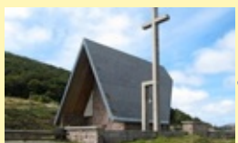
Col / Puerto de Ibañeta